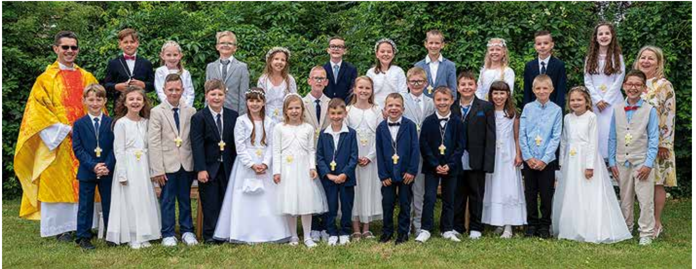
→ Am 24. Juni 2023 wurde in der röm.-kath. Pfarre Neufelds die Erstkommunion gefeiert.

So oder so ähnlich könnte das Motto beim Pfarrheurigen am 8. und 9. September gelaute haben: Bei bestem Wetter gab es Gelegenheit für Gespräche und gemütliches Zusammensein bei Speis und Trank. Fortsetzung folgt – nächsten Sommer!