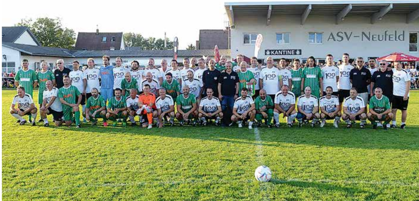
→ Legenden unter sich: Zum 100-Jahre-ASV-Jubiläum trafen jene von Rapid Wien in Grün auf jene des ASV Neufeld

Ein besonderes Highlight war das Spiel zwischen den mit Stars gespickten SC Rapid-Legenden gegen die ASV Neufeld-Legenden – vor nicht weniger als 1.500 Zuschauern.