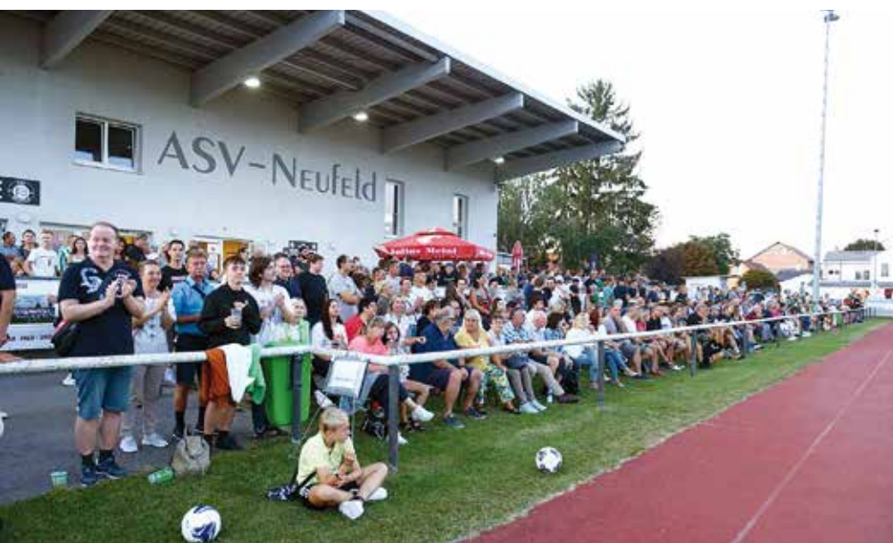
→ Rund 1.500 Zuschauer wohnten den Feierlichkeiten am ASV-Platz bei.