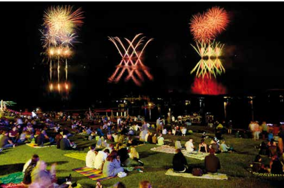
→ Das Neufelder Seefest 2023 – Fotos oben und unten – unterhielt mit seinem Klangfeuerwerk und bester Musik Jung und Alt gleichermaßen.

Abwechslungsreiche Sommermonate luden mit coolen Events bei oftmals sehr schönem Wetter zum Feiern ein.