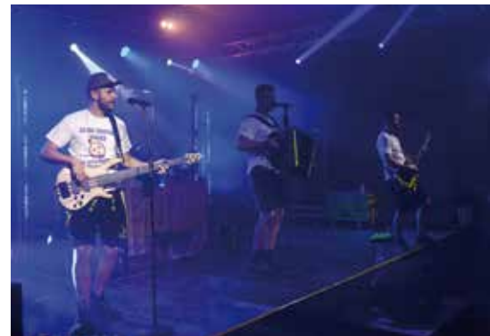
→ Die Party-Hirschen sorgten für Hochstimmung im ASV-Festzelt

und spannenden Spiel trennten sich die Top-Teams in der Kampfmannschaft mit einem 2:2, wobei das Chancenplus sicherlich bei unserer Truppe lag. Die U23 Mannschaft des ASV Neufeld konnte sich gegen den amtierenden Reserve-Meister mit einem verdienten 2:1-Sieg durchsetzen.