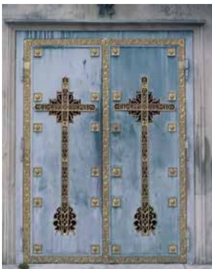
→ Radetzky-Gedenkstätte Heldenberg