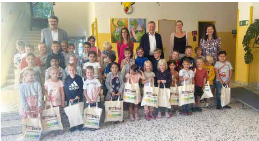
→ Trinkflaschen, Jausenbox und Co. für die Erstklassler der Volksschule Neufeld

Die Stadtgemeinde Neufeld/L. wollte zusätzlich unterstützen und stellte den Taferlklasslern den Schulstartbonus unbürokratisch und ohne jedwede Antragstellung gleichzeitig mit der Übergabe der „EMIL“-Flaschen und der Jausenboxen zur Verfügung. ◆