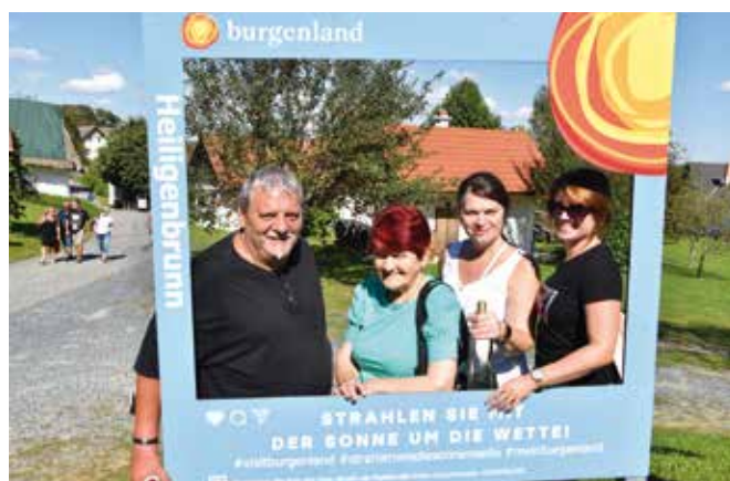
→ KOBV-Ausflug ins Südburgenland

Öffnungszeiten: Mo-Fr: 8-12 und 15-18 Uhr Samstag: 8-12 Uhr