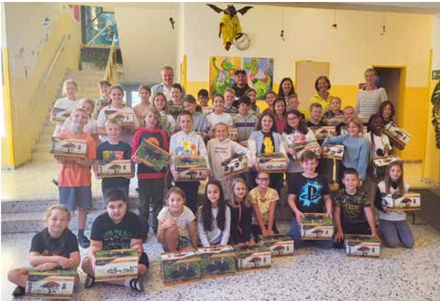
→ Fahrradhelme für die Viertklassler der Lollipop-Volksschule Neufeld

Aktion dient der Verkehrssicherheit unserer jüngsten VerkehrsteilnehmerInnen, die im heurigen Schuljahr unter fachlicher Begleitung der Polizeiinspektion Neufeld die Fahrradausbildung und -prüfung absolvieren. Der Grund für die zeitige Übergabe der Fahrradhelme kurz nach Schulbeginn liegt darin, dass die Kinder bereits bei den Übungsfahrten für die Fahrradprüfung den Kopfschutz benutzen können und die Eltern nicht zusätzlich einen Helm kaufen müssen. Die Fahrradprüfung wird erst Ende des Frühjahrs 2024 stattfinden, aber die Vorbereitungen laufen bereits jetzt. Für die Kinder ist das immer ein ganz besonderes Ereignis, vom Herrn Bürgermeister persönlich einen eigenen Helm überreicht zu bekommen! Darüber hinaus ist das ein überaus wichtiger Beitrag zur Hebung der Verkehrssicherheit und zum Schutz vor schwereren Folgen eines Sturzes mit dem Fahrrad! ◆