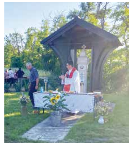
→ oben: Ratschenbubenmesse beim Neufelder Marterl → links: das fleißige Team des diesjährigen Pfarrheurigen

ING. ZEILER Metallbau GmbH & Co.KG FENSTER • TÜREN • TORE • MONTAGE • SERVICE DR. KARL RENNER-STRASSE 39, 2491 NEUFELD TEL. 0 26 24 / 52 3 48 • FAX: DW 4