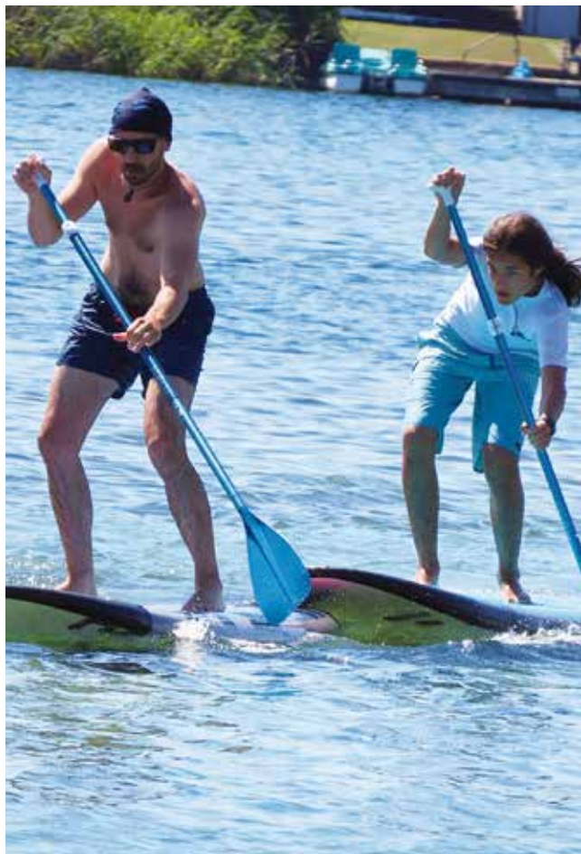
→ Surf- & Freizeitclub Neufeld: Stand-Up-Paddeln (oben), Surfen (unten) oder einfach das Urlaubsfeeling genießen ...