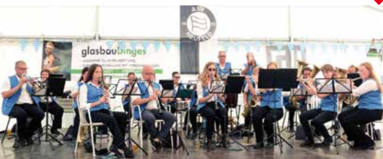
→ Der AMV zu Gast beim 100-Jahr-Jubiläum des ASV

Auch heuer endet das Jahr für uns musikalisch mit dem Konzert in der Kirche. Am 19. November um 17 Uhr sind Sie schon heute sehr herzlich dazu eingeladen. Gemeinsam mit dem Chor „Da Koa“ aus Ebreichsdorf haben wir ein abwechslungsreiches Programm für Sie vorbereitet. Die Proben laufen bereits. Wir freuen uns auf Ihren Besuch.