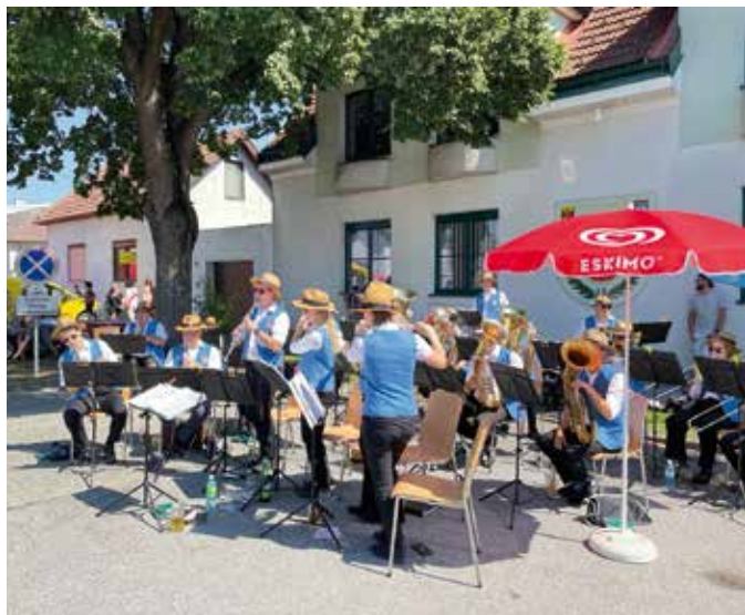
→ Hochsommerlicher Auftritt des AMV beim Bauernmarkt